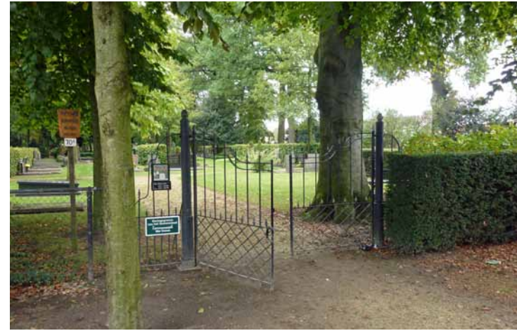
De toegangspoort en enkele hoge bomen van de monumentale begraafplaats aan de Molenstraat in Helmond.