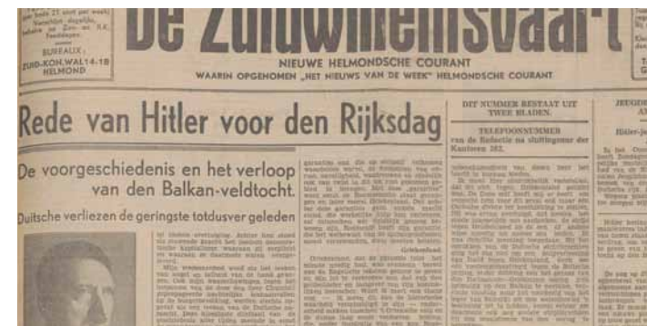
De Zuidwillemsvaart deed uitgebreid verslag op de voorpagina van Hitler's rede voor de Rijksdag.