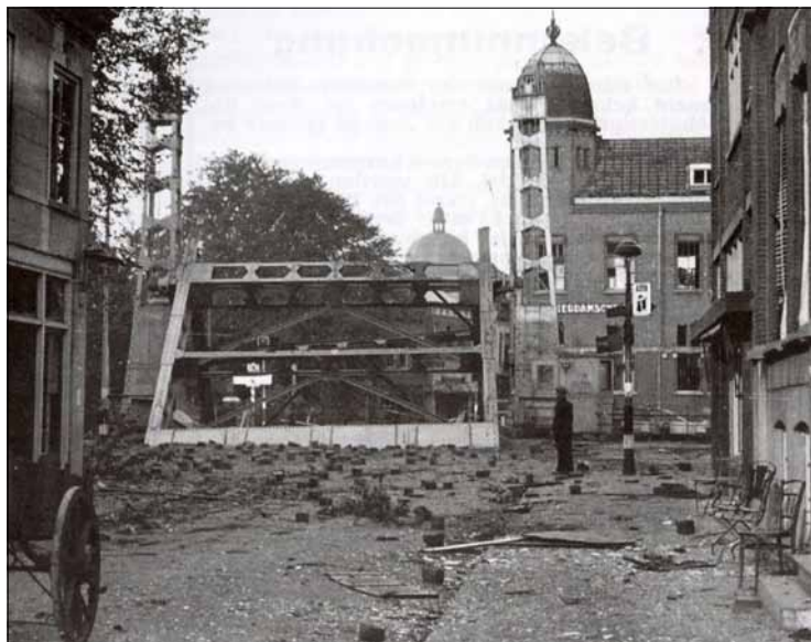
In september 1944 werden bruggen en sluizen opgeblazen door Hitler's Sprengkommando.