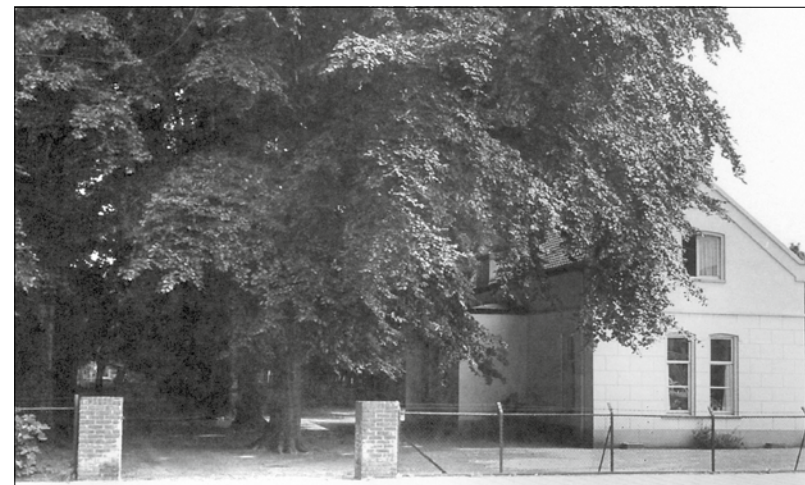
Ook het woonhuis van beheerder Moes aan de Molenstraat, stond tussen prachtige hoge bomen.

De kerkvoogd negeerde de uitspraak en zei gekomen te zijn om te informeren of het inderdaad waar is dat de bomen op de begraafplaats gerooid zullen worden: 'Uit naam van de kerk protesteer ik ten zeerste tegen het hakken van de bomen en het plegen van grafschennis' . Het antwoord van Maas was kort, lomp en bondig. 'De bomen op de begraafplaats worden geveld, al zijn die nog zo oud en al zou daar de hele stad begraven liggen. Alles wat Duitsland in de weg staat is nutteloos' . De kerkvoogd begreep dat er niets meer te redden viel. Hij bedacht dat hijzelf misschien een goede afloop in