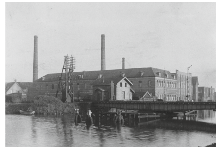
De spoorbrug werd uit voorzorg al opgeblazen.