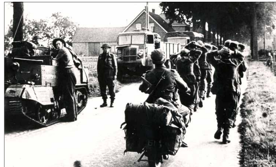
De Rooseindsestraat gezien in de richting van de Duizeldonksestraat. Duitse soldaten worden als gevangenen afgevoerd.

De Britten zetten door. Via de Houtse Parallelweg en de Mierloseweg bereikten ze Helmond West. Vanuit enkele huizen werd door scherpshutters geschoten, waarbij enkele burgers, in de laatste uren van de bezetting, de prijs van de vrijheid met hun leven moesten bekopen. Behalve glasschade, waarin vrijwel iedereen zijn aandeel had, werden een paar gebouwen door granaten getroffen en brandden uit. Helmond West was bevrijd, maar kon dat niet vieren omdat er nog veel stadsgenoten in de schuilkelders zaten.