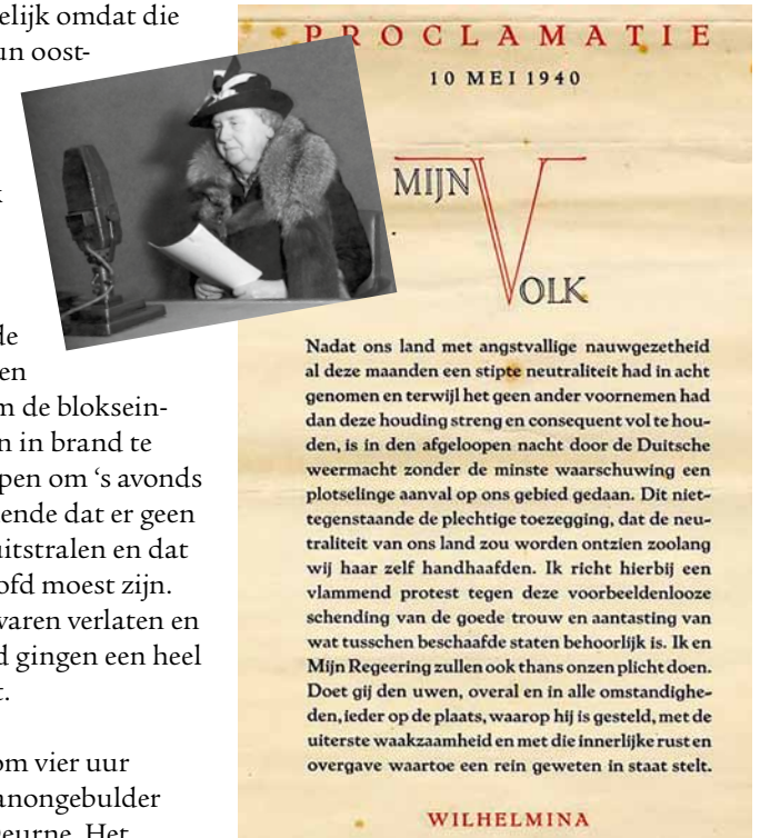
Op 10 mei 1940 las koningin Wilhelmina deze proclamatie voor om 8 uur 's morgens op de radio. ( www.betgebeugenvannderland )

De volgende morgen om vier uur begon het hier. Er werd kanongebulder gehoord uit de richting Deurne. Het bleek dat de Peel-Raamstelling meteen de eerste dag al was gevallen. Dat betrof de verdedigingslinie die zich zo'n 9 tot 21 km achter de Maastricht bevond. De Peel-Raamstelling liep van Grave via Mill, door de Peel, langs de Zuid-Willemsvaart bij de Belgische grens tot Weert. De Nederlandse soldaten die zich daar achter die verdedigingslinie hadden teruggetrokken, stroomden een paar uur later Helmond binnen. Om zes uur zag de Markt