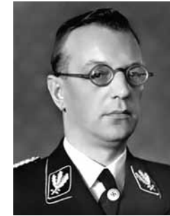
Op 23 mei 1940 bezocht Arthur Seyss Inquart een vriend in Mierlo-Hout.

Maar vanaf het voorjaar van 1942 veranderde die houding. Hij zette zich steeds meer af tegen de Duitse maatregelen. Vooral tegen de maatregel waar-